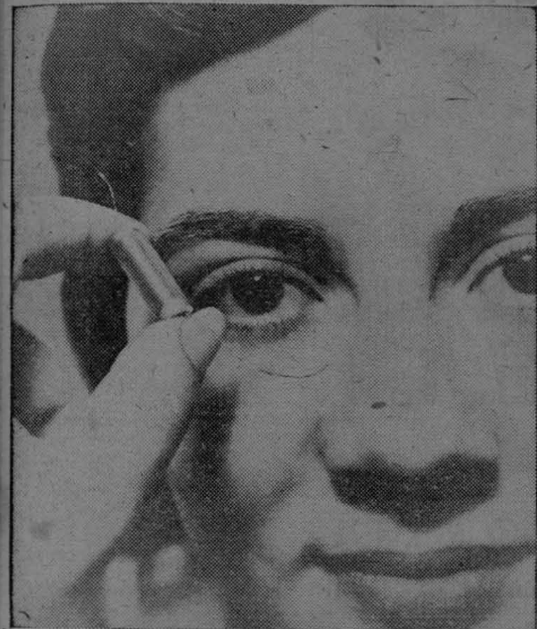
Modelo de la más pequeña batería eléctrica creada hasta el presente y que puede proporcionar 95 voltios de energía. Será utilizada para el fomento de la ciencia electrónica. La muestra entre sus dedos, una bella empleada de la fábrica que en Auburn, Nueva York, se construyen ya en gran escala.